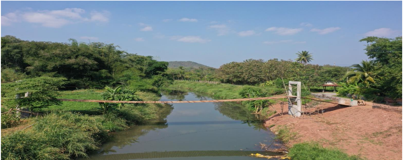
รูปตัดขวางลำน้ำ ปีน้ำ 2566 สถานี N.39 น้ำปาด อ.ปากท่า จ.อุตรดิตถ์